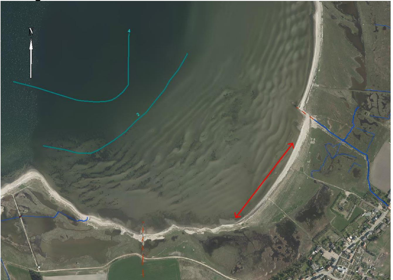
Figur 1: Oversigtskort over Karby. Stranden er ca. 300 meter lang og udstrækningen er markeret med den røde streg. I vandet ses hvor henholdsvis 2 og 4-meter dybdekurven går.