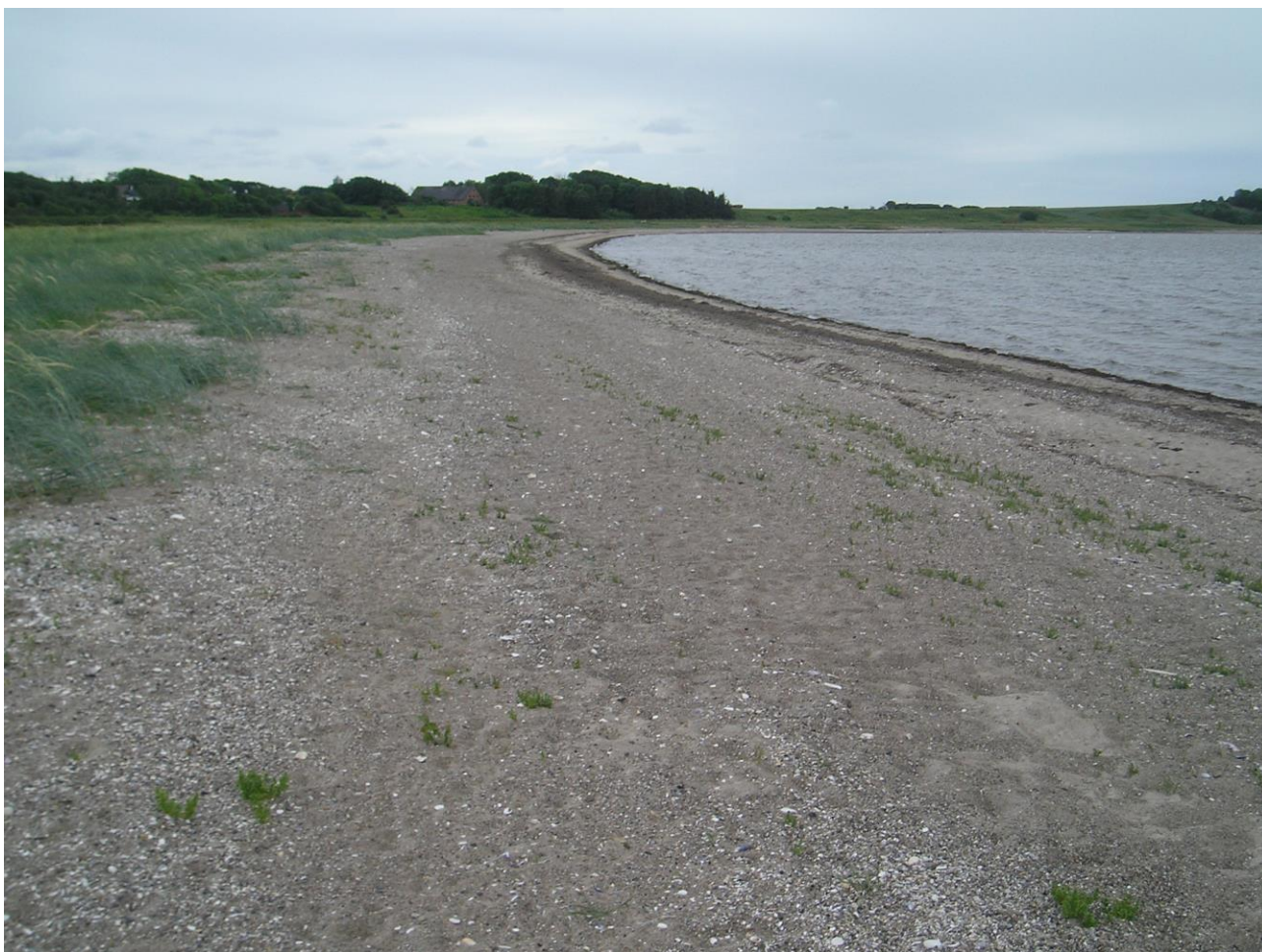
Figur 2: Billede fra Karby.